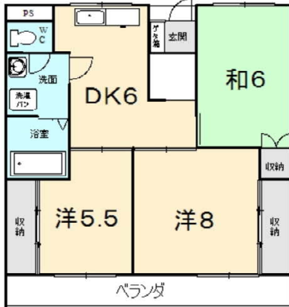
現地案内図・間取り図