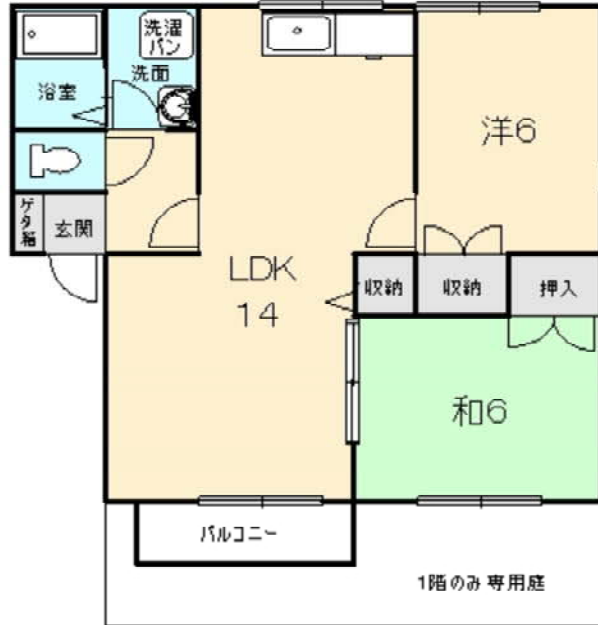
現地案内図・間取り図