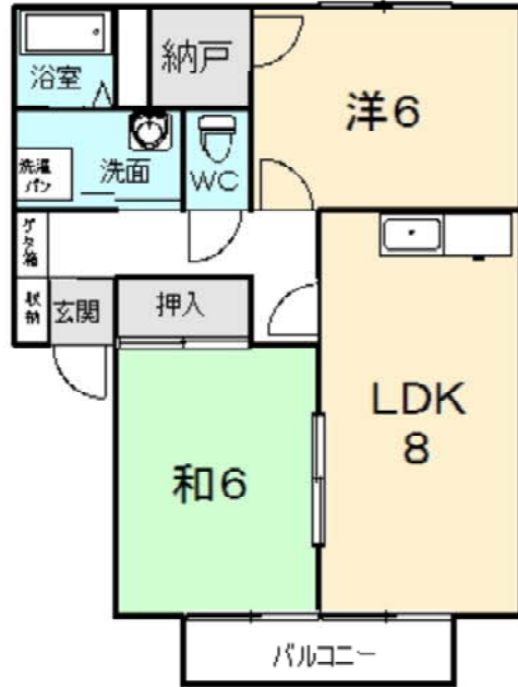
現地案内図・間取り図